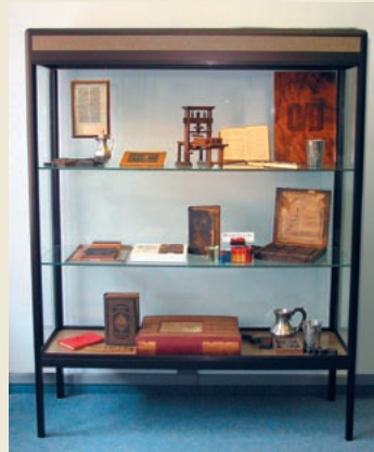
Stadtgeschichtliches Museum Linxweilerstraße 5 66564 Ottweiler