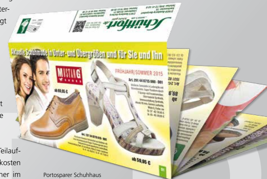
Portosparer Schuhhaus Schüttfort GmbH

Ein besonderer Service ist die Logistikabwicklung in Frankreich. Als zertifizierter Partner der französischen Post wird auch das Porto optimiert und die Postauflieferung erfolgt in Metz.