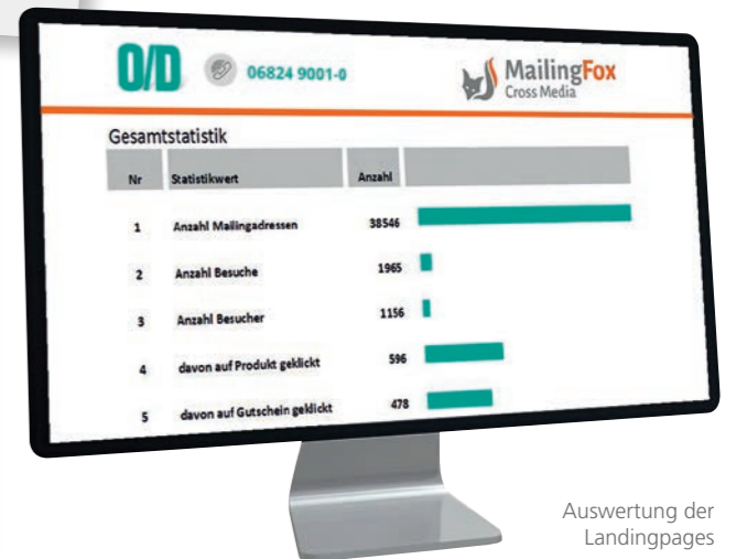
Auswertung der Landingpages

Analog zu jeder Webseite lässt sich die Landing-Page auf die unterschiedlichsten Arten und Weisen auswerten. Neben der Protokollierung jeder Aktion des Besuchers ist natürlich eine Tagesstatistik mit der Summe der Besucher und ihren Aktionen verfügbar. So können Sie nachfolgend gezielte Werbeaktionen starten.